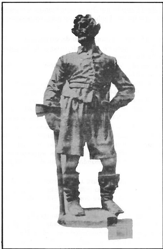
Pascoal Moreira Cabral – escultura de Amadeu Zani (Museu Paulista, São Paulo)

Com referência à criação, também parecia a Cabral Camelo que não havia terras melhores que as de Cuiabá. Não só para bois como para porcos, galinhas e cabras, “e também o seriam para cavalos se houvessem (sic) éguas nelas”.