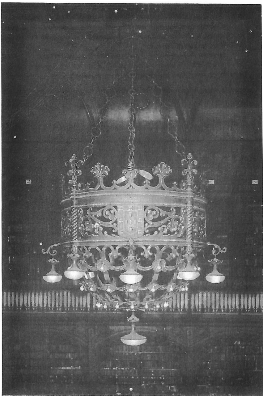
Real Gabinete Português de Leitura – “Lustre de Biblioteca”